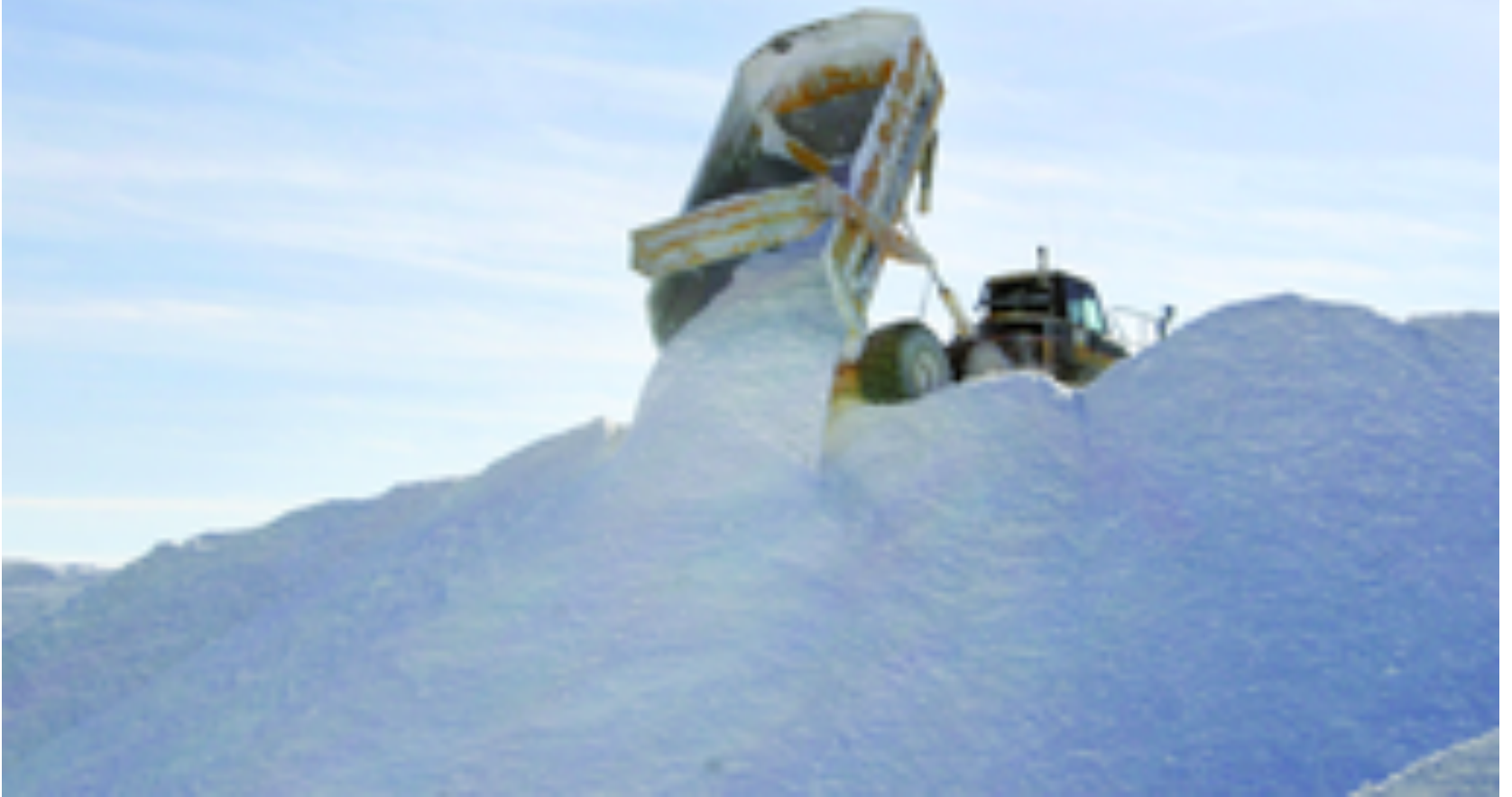
Le lithium sort de sa bulle