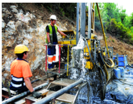
Le Portugal dans la course au lithium