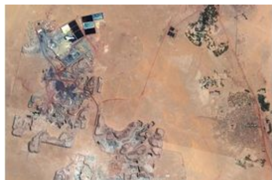
Le directeur général d'Orano en visite au Niger