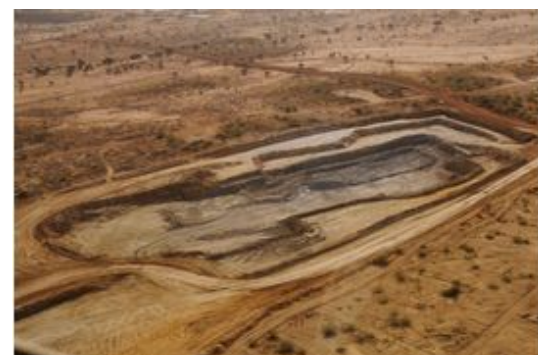
Pour fonder un géant de l'or, Barrick Gold veut s'offrir Randgold Resources