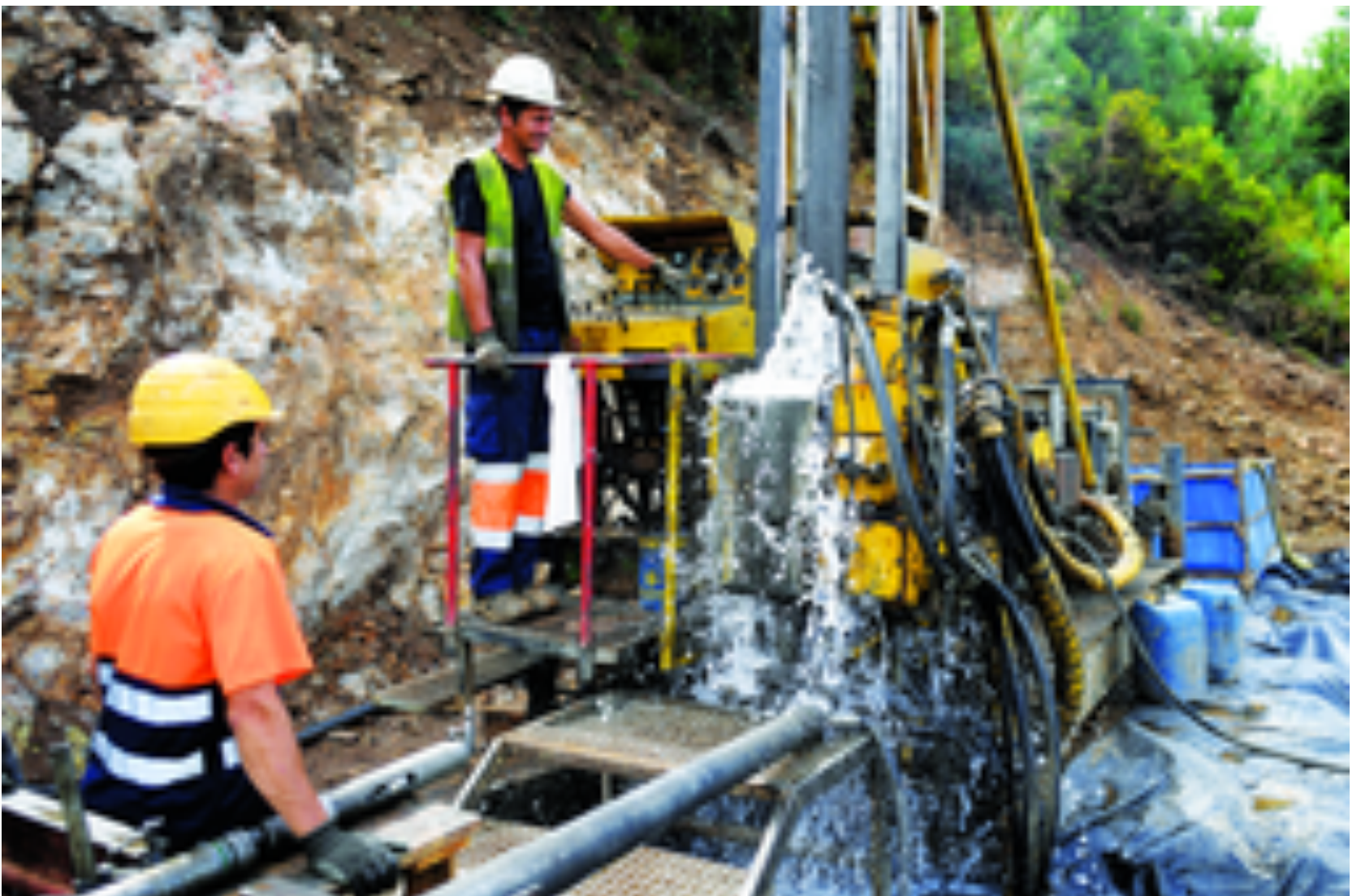
Le Portugal dans la course au lithium